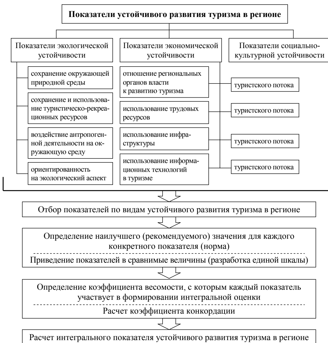
Рис. 3. Методический подход к оценке эффективности развития туризма в регионе

1. На первом этапе необходимо осуществить отбор показателей, которые характеризуют отдельные виды устойчивого развития туризма в регионе. Количество таких показателей не должно быть очень большим, они должны быть независимыми друг от друга и достаточно полно характеризовать исследуемый объект.