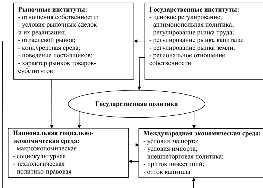
Рис. 1. Взаимодействие институтов рынка и государства

Провалы рынка вызывают необходимость коррекции ряда процессов, справиться с которыми самому рынку сложно.