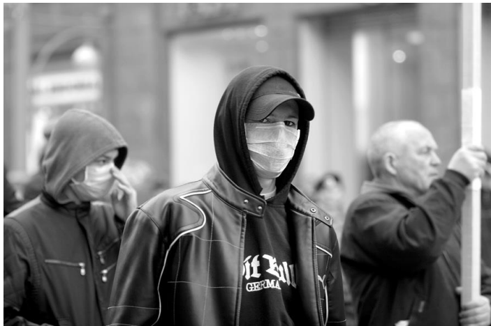
Экстремистски настроенная молодежь на митинге в Казани 20

Экстремизм (от лат. extremus – «крайний») трактуется как приверженность к крайним взглядам и мерам (обычно в политике), среди которых можно отметить провокацию беспорядков, гражданское неповиновение, террористические акции, методы партизанской войны.