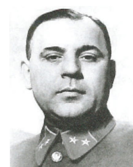
Комбриг Фролов С.Ф. Начальник МПВО г. Москвы с 1940 г. по 1942 г.