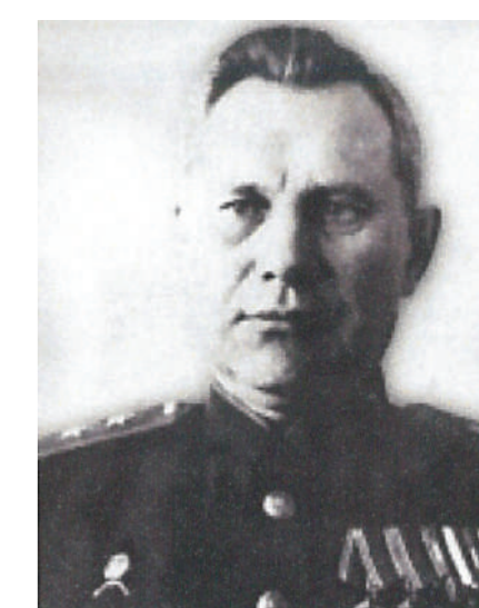
Генерал-лейтенант Королёв М.Ф. Начальник МПВО г. Москвы с августа 1942 г. до конца войны

За годы войны на тыловые объекты страны совершено 659 445 вражеских самолётных вылетов, в ходе которых сброшено около 600 тысяч фугасных и около 1 миллиона зажигательных авиабомб .