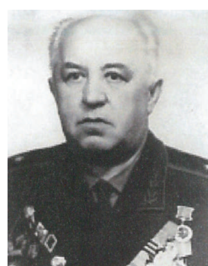
Генерал-майор Лагуткин Е.С. Начальник МПВО г. Ленинграда с 1938 г. по 1948 г.