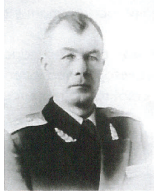
Генерал-лейтенант Шередега И.С. Начальник ГУ МПВО МВД СССР с 1950 г. по 1956 г.