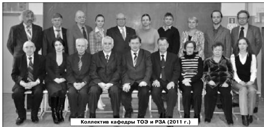
Коллектив кафедры ТОЭ и РЗА (2011 г.)