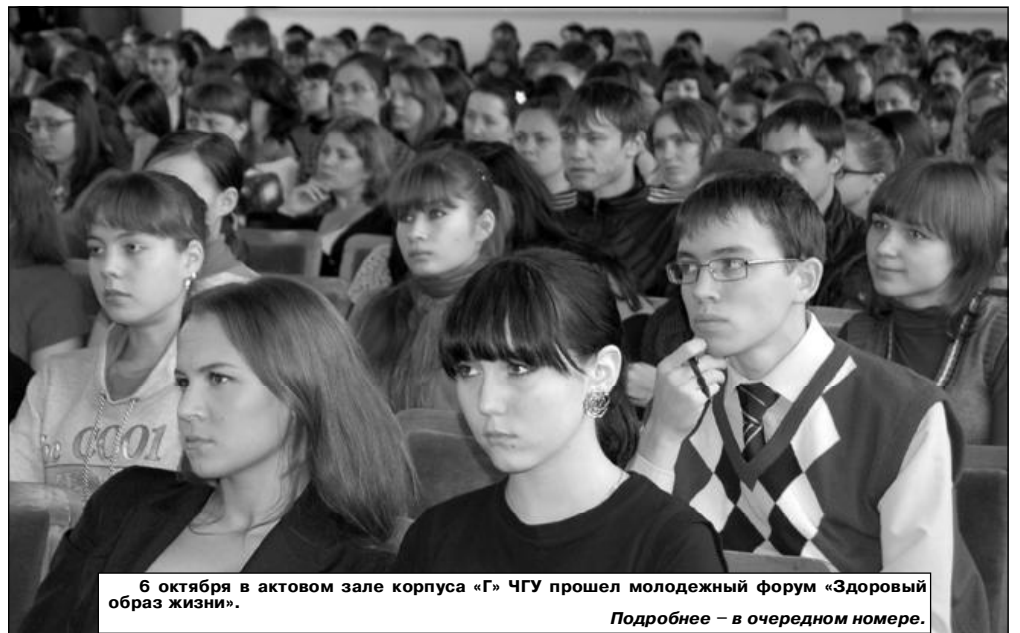
6 октября в актовом зале корпуса «Г» ЧГУ прошел молодежный форум «Здоровый образ жизни».

Московский пр., 15, корп. «Г», каб. К-301 и К-302 (3 эт.). Тел.: 58-13-12, 58-50-98 (доб. 2459).