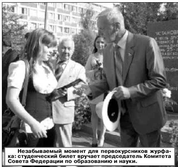
Незабываемый момент для первокурсников журфака: студенческий билет вручает председатель Комитета Совета Федерации по образованию и науке.