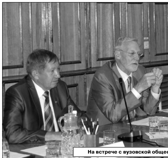
На встрече с вузовской общественностью: откровенные вопросы – исчерпывающие ответы.