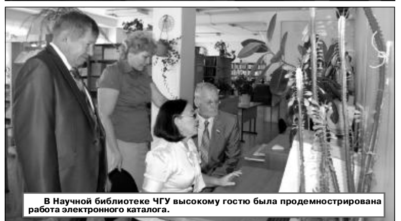
В Научной библиотеке ЧГУ высокому гостю была продемонстрирована работа электронного каталога.