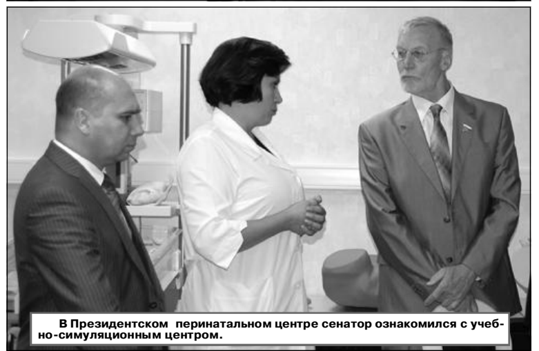
В Президентском перинатальном центре сенатор ознакомился с учебно-симуляционным центром.