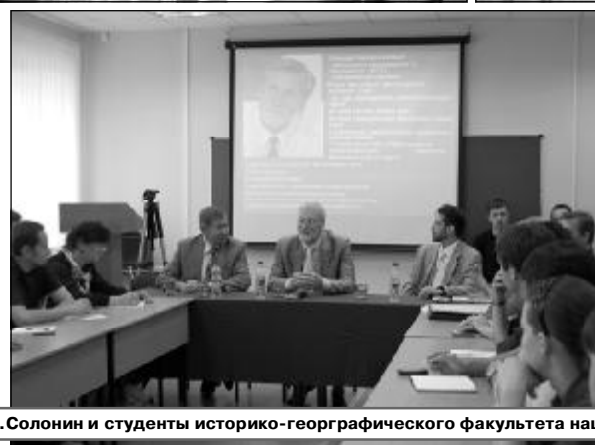
Сенатор Ю.Н.Солонин и студенты историко-географического факультета нашли общий язык.