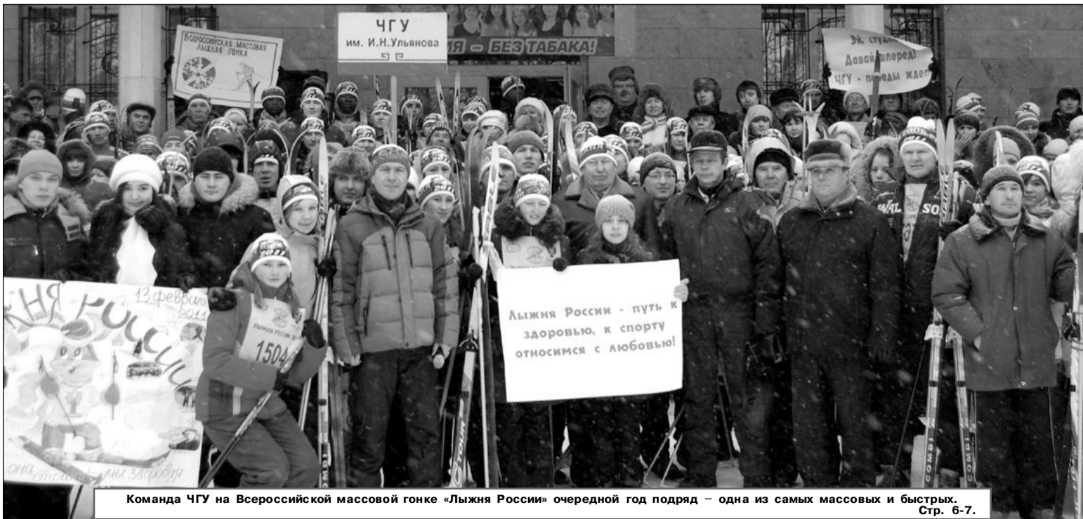
Команда ЧГУ на Всероссийской массовой гонке «Лыжня России» очередной год подряд – одна из самых массовых и быстрых.