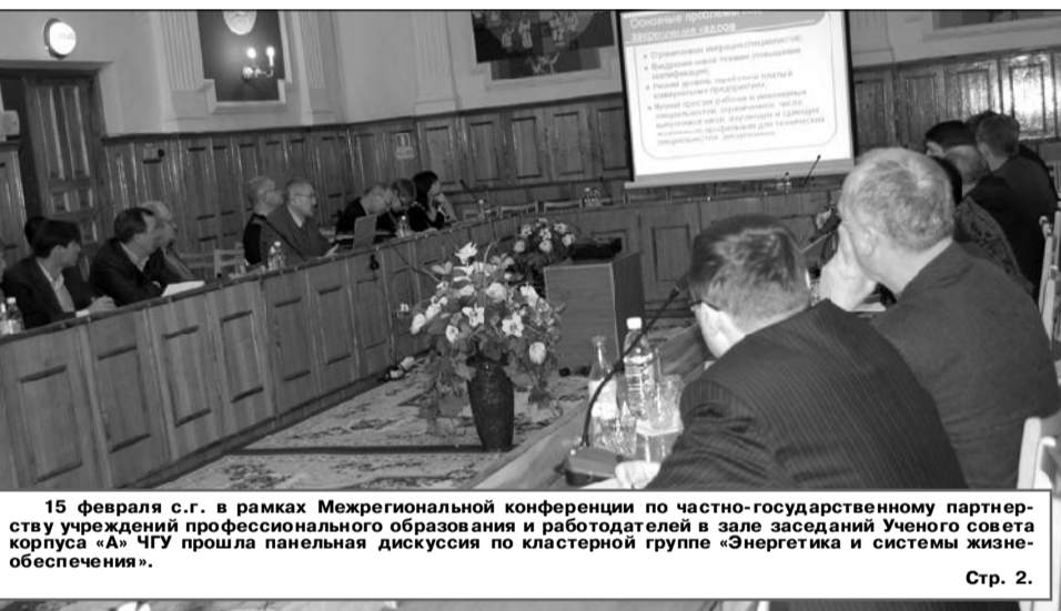
15 февраля с.г. в рамках Межрегиональной конференции по частно-государственному партнерству учреждений профессионального образования и работодателей в зале заседаний Ученого совета корпуса «А» ЧГУ прошла панельная дискуссия по кластерной группе «Энергетика и системы жизнеобеспечения».

«Согласно клятве Гипократа врач должен обладать в глазах сокола, руками девушки, мудростью змеи и сердцем льва. А чтобы лечить людей, нужно еще и хорошо знать свое дело, быть профессионалом...» (Стр. 10).