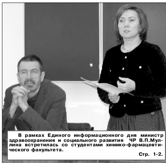
В рамках Единого информационного дня министр здравоохранения и социального развития ЧР В.П.Мулина встретилась со студентами химико-фармацевтического факультета.