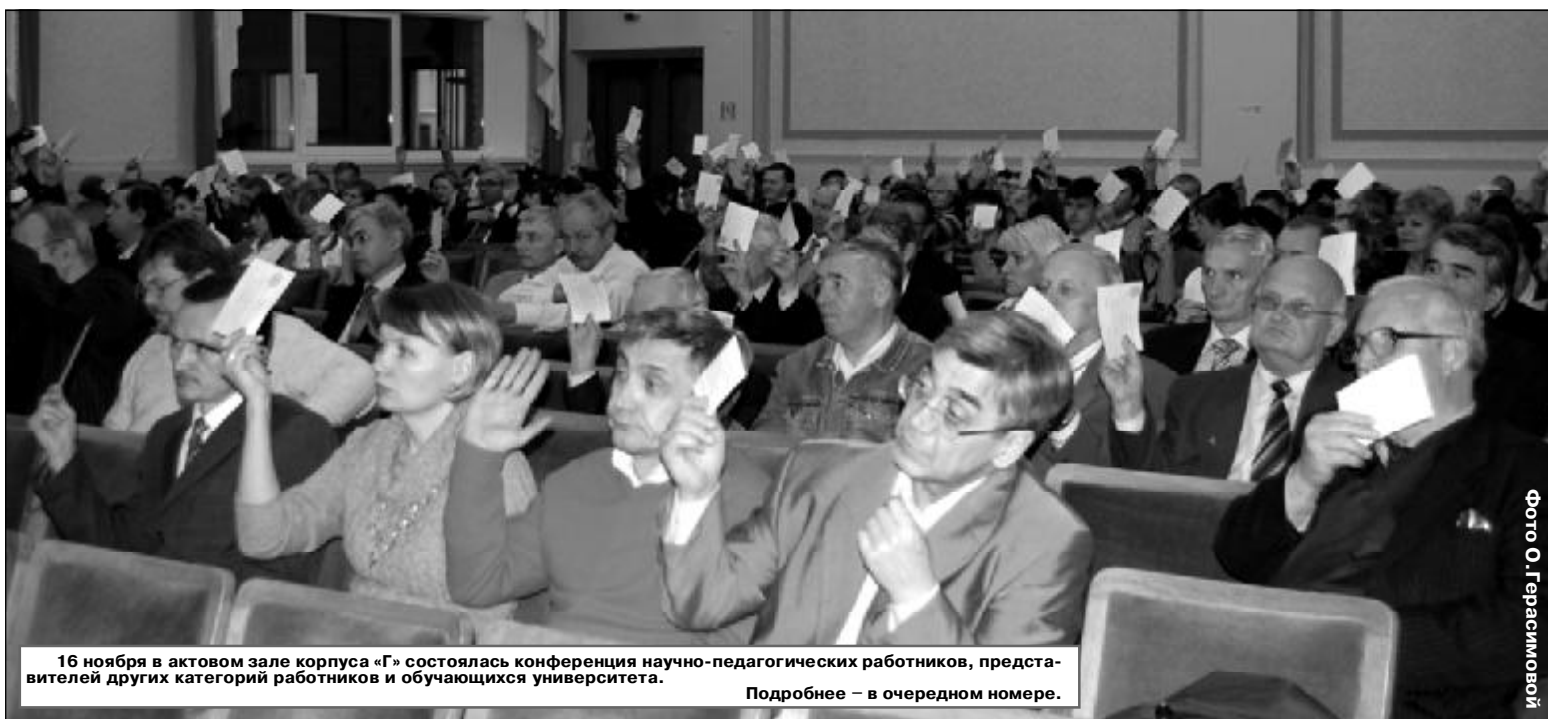
16 ноября в актовом зале корпуса «Г» состоялась конференция научно-педагогических работников, представителей других категорий работников и обучающихся университета.