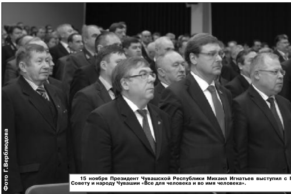
15 ноября Президент Чувашской Республики Михаил Игнатьев выступил с Посланием Государственному Совету и народу Чувашии «Все для человека и во имя человека».