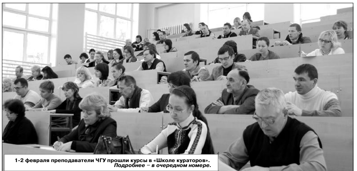
1-2 февраля преподаватели ЧГУ прошли курсы в «Школе кураторов». Подробнее – в очередном номере.

По всем вопросам обращаться в Приемную комиссию по адресу: ул. Университетская, 38 (проезд троллейбусами маршрутов № 4, 12, 14, 21 до ост. «Университет»), каб. 229. Тел.: 45-23-39, 58-18-40.