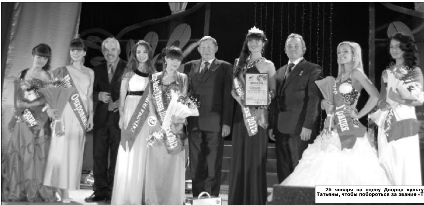
25 января на сцену Дворца культуры ЧГУ вышли красавицы-Татьяны, чтобы побороться за звание «Татьяны Поволжья»-2012. Стр. 5.