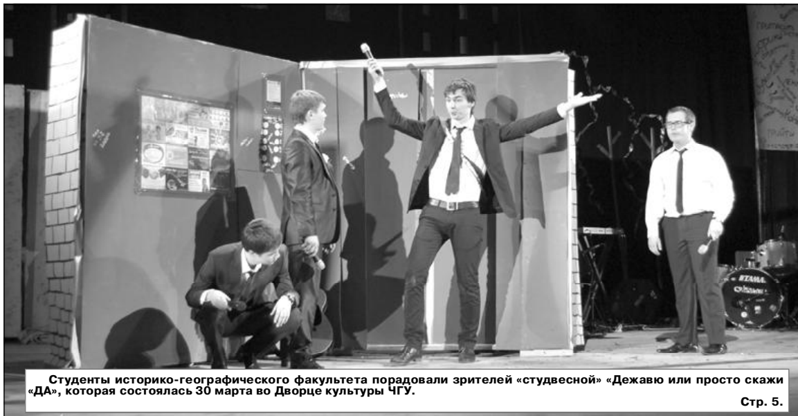
Студенты историко-географического факультета порадовали зрителей «студвесной» «Джаву или просто скажи «ДА», которая состоялась 30 марта во Дворце культуры ЧГУ.

- тематическая выставка научной литературы, посвященная Году российской истории; - выставка, посвященная 20-летию создания географического отделения; - деловая игра «Преодоление кризиса: миссия невыполнима»; - выставки лучших выпускных квалификационных (дипломных) работ; - выставка работ фотоконкурса «Наука в объективе»; - конкурс работ по арт-терапии; - выставка изделий ручной работы: «Мастерами славится Россия!» и т.д. Торжественное открытие конференции и «Недели науки» состоится 10 апреля в зале заседаний Ученого совета корпуса «А». Начало – в 11.00 часов.