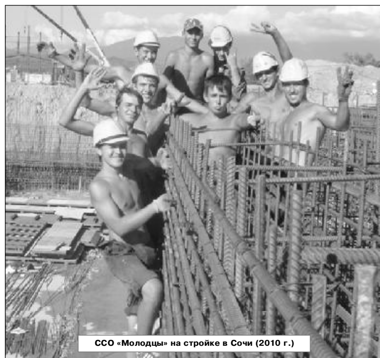
ССО «Молодцы» на стройке в Сочи (2010 г.)

Хотелось бы отметить, что наши бойцы отличились в положительном смысле этого слова дисциплиной и организованностью. Доказательством этому служат многочисленные награды от руководства строительных объектов, полученные ребятами в 2011 году.