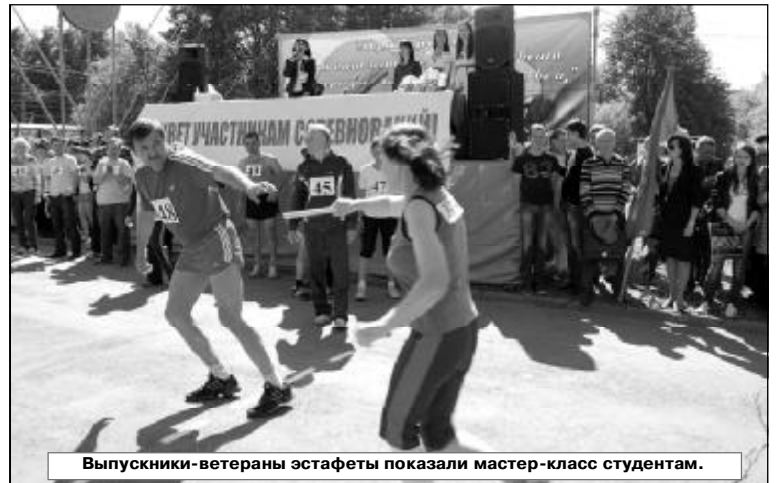
Выпускники-ветераны эстафеты показали мастер-класс студентам.