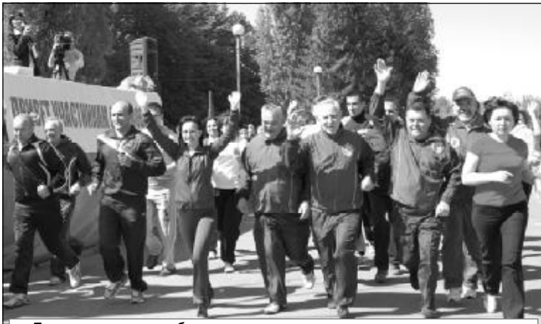
Первыми трассу опробовали проректора и руководители структурных подразделений вуза.