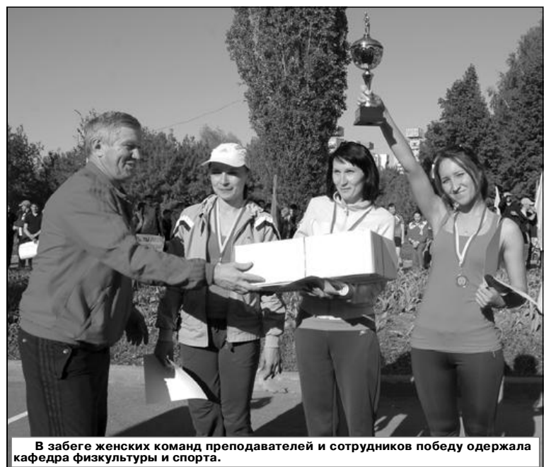
В забеге женских команд преподавателей и сотрудников победу одержала кафедра физкультуры и спорта.