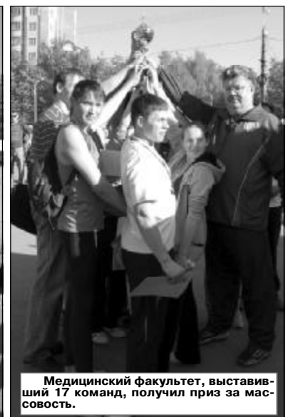
Медицинский факультет, выставивший 17 команд, получил приз за массовость.