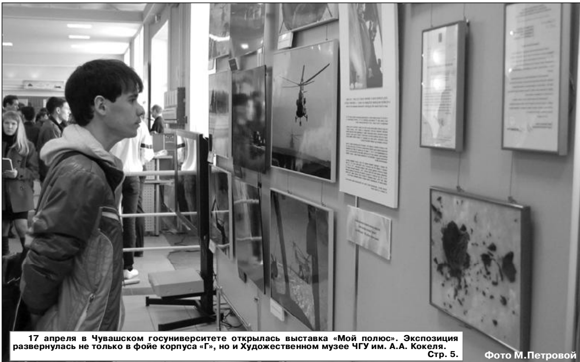
17 апреля в Чувашском госуниверситете открылась выставка «Мой полюс». Экспозиция развернулась не только в фойе корпуса «Г», но и в Художественном музее ЧГУ им. А.А. Кокеля.