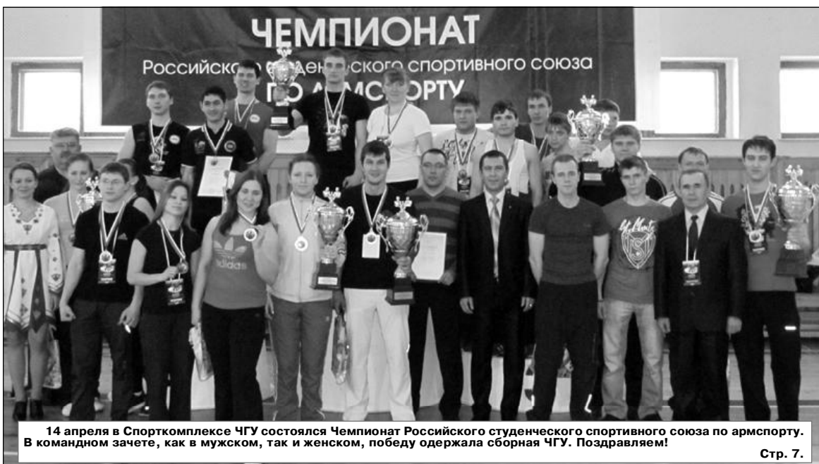
14 апреля в Спорткомплексе ЧГУ состоялся Чемпионат Российского студенческого спортивного союза по армспорту. В командном зачете, как в мужском, так и женском, победу одержала сборная ЧГУ. Поздравляем!