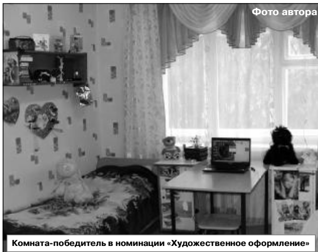
Комната-победитель в номинации «Художественное оформление»