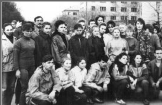
1992 г. Команда факультета чувашской филологии и культуры заняла III место.

Вот уже 50-й раз традиционная легкоатлетическая эстафета на призы газеты «Ульяновец» соберет вокруг себя любителей спорта и активного образа жизни. Своё начало эстафета в Чувашии берет с 1963 года – с Волжского филиала Московского энергетического института, на базе которого в 1967 году открылся Чувашский госуниверситет им. И.Н. Ульянова. В свою очередь, в апреле 1968 года в стенах ЧГУ начинает издаваться печатный орган – газета «Ульяновец», в честь которой эстафету начинают называть «Традиционная легкоатлетическая эстафета на призы газеты «Ульяновец». За долгие годы существования она претерпела множество изменений: менялись трасса, название («Большая Волжская эстафета» – эстафета «Ульяновец» – эстафета на призы газеты «Ульяновец»), но спортивный дух, задор, азарт участников остался неизменен.