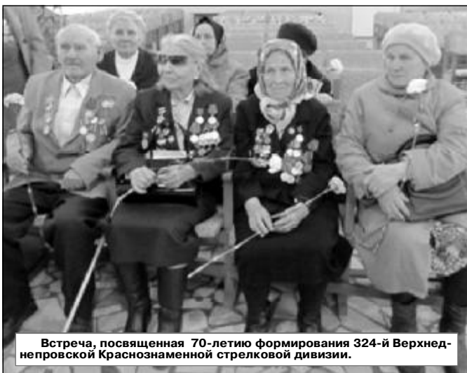
Встреча, посвященная 70-летию формирования 324-й Верхнеднепровской Краснознаменной стрелковой дивизии.

Важно помнить и о подвиге чувашского народа в Великой Отечественной войне. Невелика по территории наша республика. Если взглянуть на карту страны, то по сравнению с другими она вроде бы совсем и незаметная. Однако вклад чувашского народа в общую борьбу за свободу, честь и независимость Родины оказался немалым. В январе 1942 года был завершён разгром гитлеровских войск под Москвой. Были освобождены Московская, Рязанская, Тульская области.