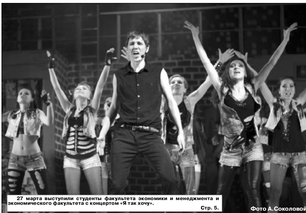
27 марта выступили студенты факультета экономики и менеджмента и экономического факультета с концертом «Я так хочу».