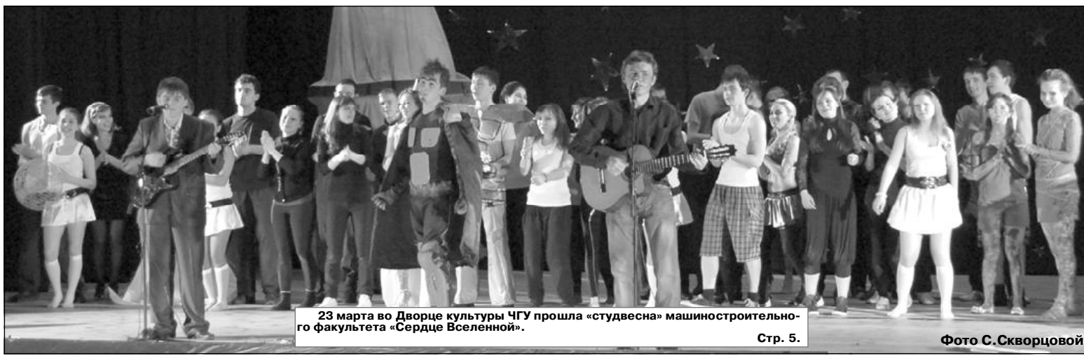
23 марта во Дворце культуры ЧГУ прошла «студвесна» машиностроительного факультета «Сердце Вселенной».