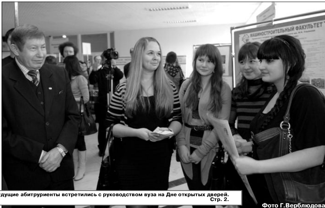
17 декабря будущие абитуриенты встретились с руководством вуза на Дне открытых дверей. Стр. 2.