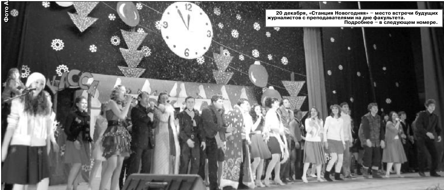
20 декабря, «Станция Новогодняя» – место встречи будущих журналистов с преподавателями на дне факультета. Подробнее – в следующем номере.