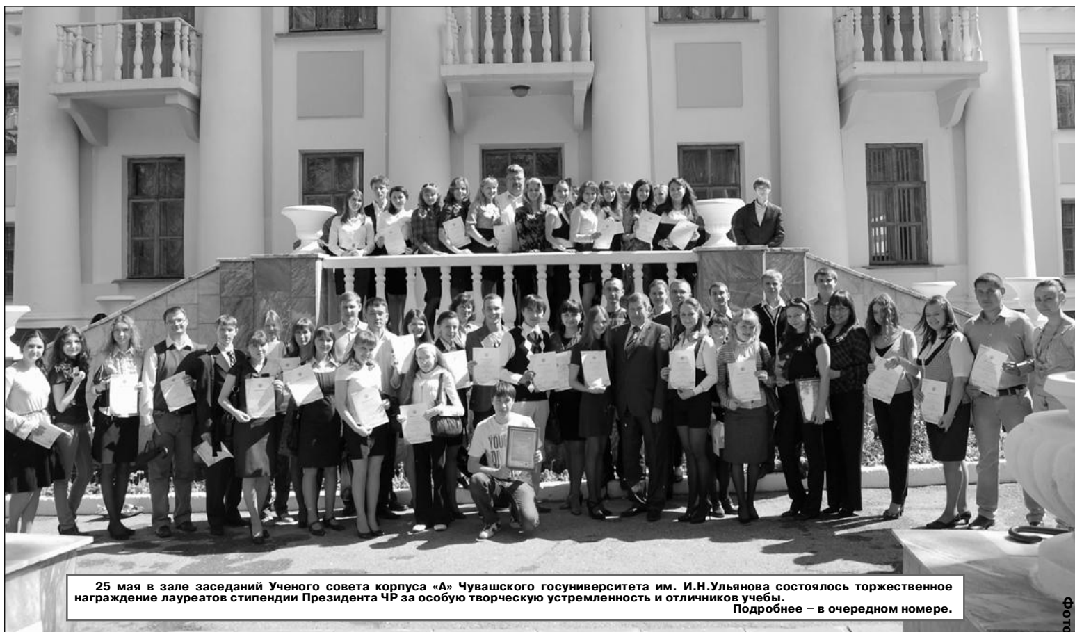
25 мая в зале заседаний Ученого совета корпуса «А» Чувашского госуниверситета им. И.Н.Ульянова состоялось торжественное награждение лауреатов стипендии Президента ЧР за особую творческую устремленность и отличников учебы. Подробнее – в очередном номере.

«Культурной нацией современных стали эстафетные забеги сильнейших спортсменов-студентов. И уж тут во всей красе показала себя женская пятерка факультета журналистики...» (Стр. 8).