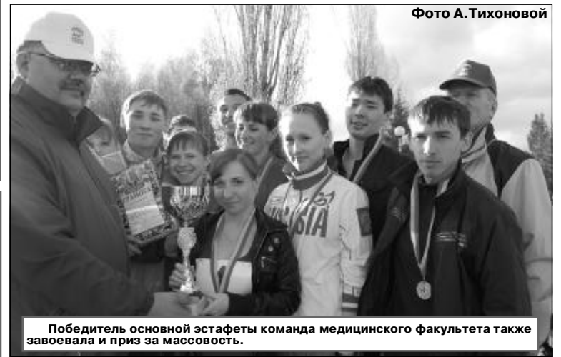
Победитель основной эстафеты команда медицинского факультета также завоевала и приз за массовость.