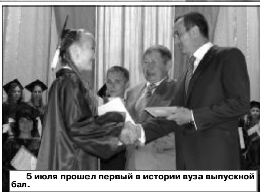
5 июля прошел первый в истории вуза выпускной бал.