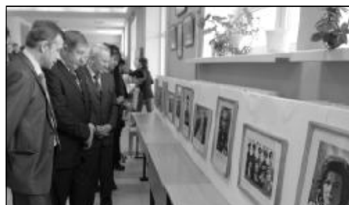
12 апреля в университете открылась выставка фотографий «Через тернии к звездам...», посвященная 50-летию полета в космос Ю.А.Гагарина и Году российской космонавтики.