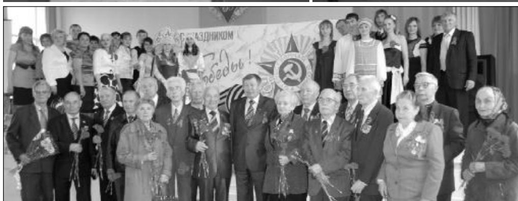
5 мая в университете состоялся концерт, посвященный Дню Победы. На праздничном мероприятии чувствовали ветеранов – участников Великой Отечественной войны и тружеников тыла.