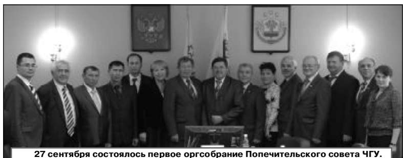
27 сентября состоялось первое оргсобрание Попечительского совета ЧГУ.