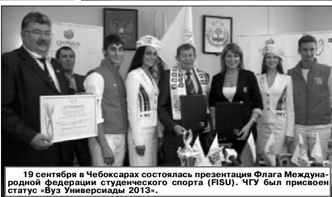
19 сентября в Чебоксарах состоялась презентация Флага Международной Федерации студенческого спорта (FISU). ЧГУ был присвоен статус «Вуз Универсиады 2013».