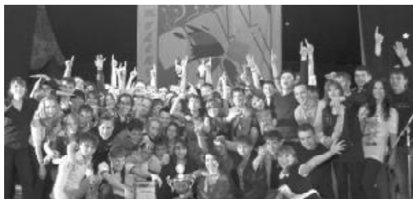
На гала-концерте «Студвесны-2011» раскрылась главная интрига сезона: победителем фестиваля стала сборная команда «ТЕХИ».