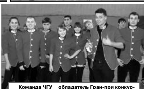
Команда ЧГУ – обладатель Гран-при конкурса «Стартап-идеи-2011».