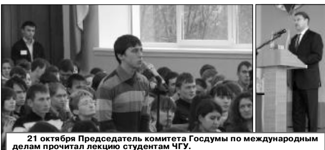
21 октября Председатель комитета Госдумы по международным делам прочитал лекцию студентам ЧГУ.