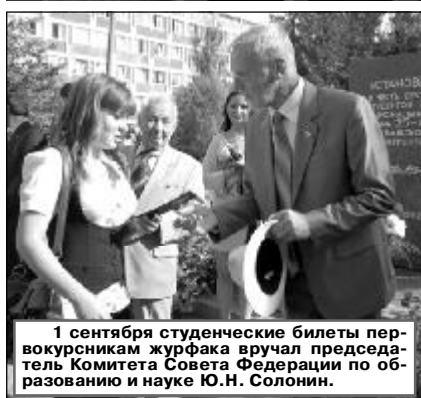
1 сентября студенческие билеты первокурсникам журфака вручал председатель Комитета Совета Федерации по образованию и науке Ю.Н. Солонин.