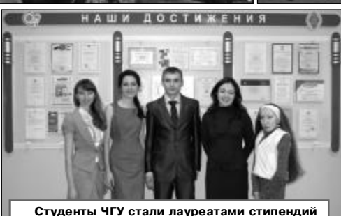
Студенты ЧГУ стали лауреатами стипендий Президента и Правительства РФ.