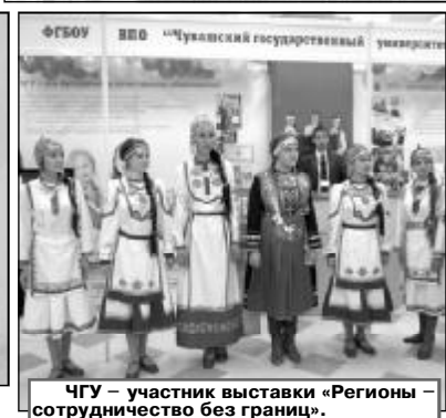
ЧГУ – участник выставки «Регионы – сотрудничество без границ».