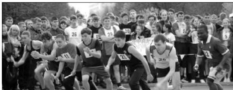
12 мая в парке им. 500-летия г. Чебоксары прошла традиционная легкоатлетическая эстафета на призы газеты «Ульяновец» – праздник спорта, бодрости и хорошего настроения.