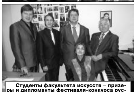
Студенты факультета искусств – призеры и дипломанты Фестиваля-конкурса русского романа «Белая акация».