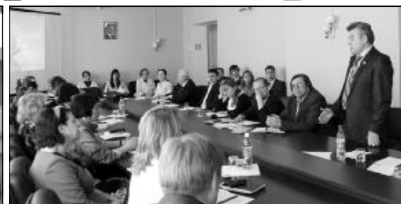
1 апреля в ЧГУ состоялся круглый стол на тему «Формы и методы профилактики курения в образовательной среде».