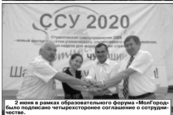
2 июня в рамках образовательного форума «МолГород» было подписано четырехстороннее соглашение о сотрудничестве.