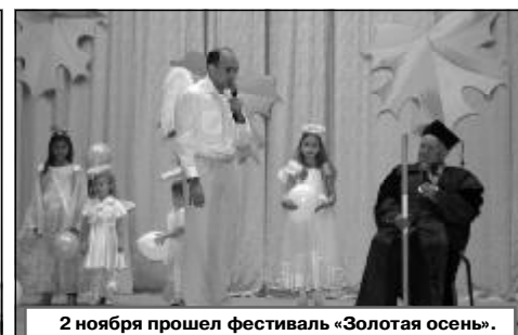
2 ноября прошел фестиваль «Золотая осень».