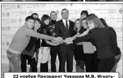
23 ноября Президент Чувашии М.В. Игнатьев встретился со студентами ЧГУ.