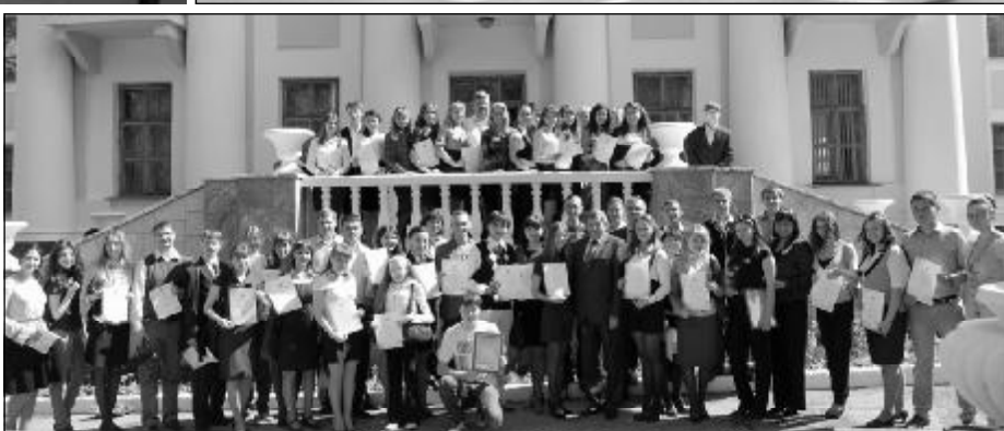
25 мая в зале заседаний Ученого совета состоялось торжественное награждение лауреатов стипендии Президента ЧР за особую творческую устремленность и отличников учебы.